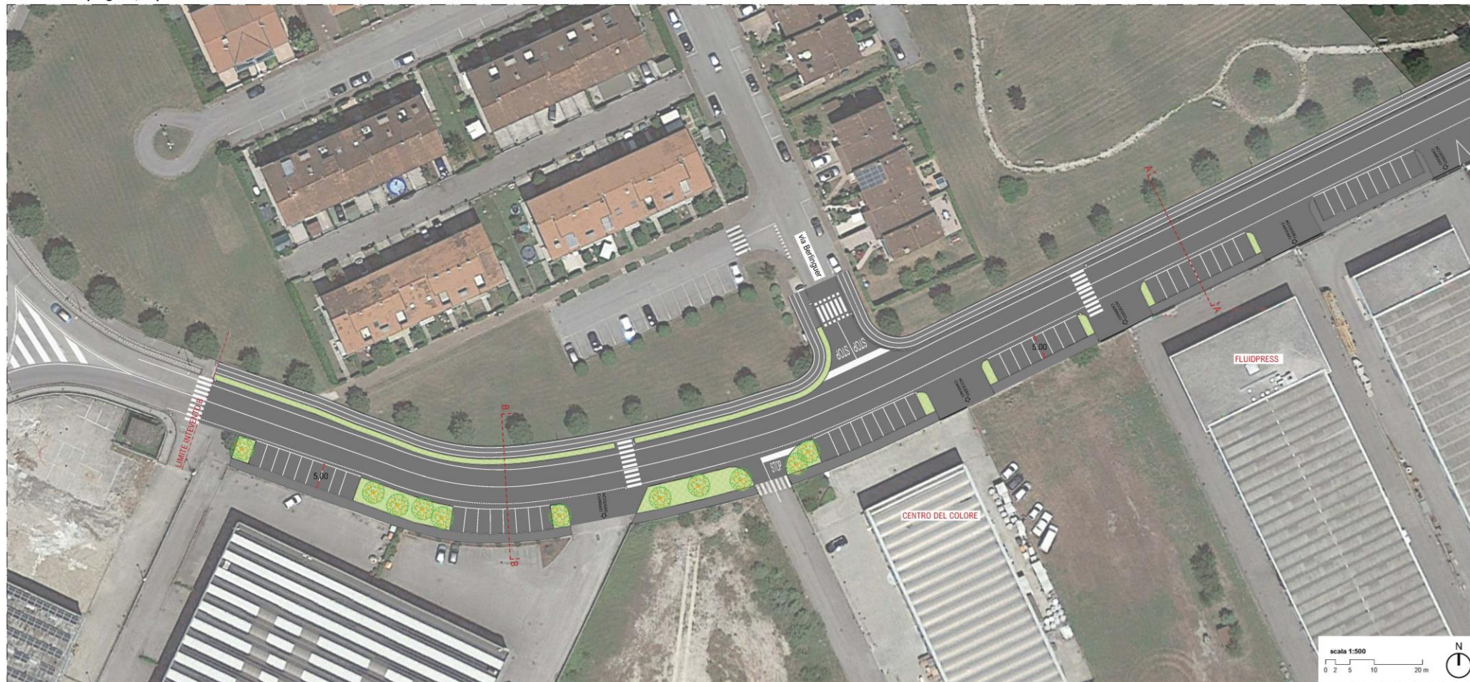
Planimetria di progetto, Inquadramento 5

Nuovi parcheggi a pettine e nuova pista ciclopedonale